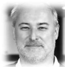
RITZ Petr SAMSUNG